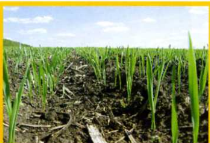
Преимущества мульчирующего сева (справа)